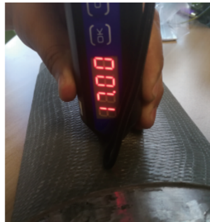
表面不平玻纤厚度为4mm厚度测量